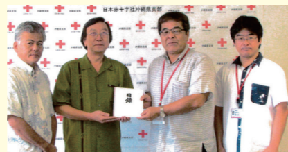
8月26日 日赤沖縄県支部にて

皆様の「あたたかい気持ち」は、被災して困っている方々へ確実に届くことと思います。