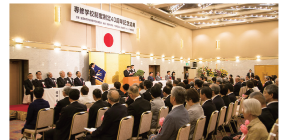
文部科学大臣表彰及び全専各連会長表彰

併せて、全国専修学校各種学校総連合会より、会長表彰及び功労ある外部の個人や団体を対象とする会長感謝状の贈呈があり、7月10日専修学校制度制定40周年記念式典にて発表されました。(アルカディア市ヶ谷にて)