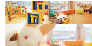
琉球リハビリテーション学院

琉リハに保育園が開園！ 27年4月より学院内に保育園を設置。教職員はもちろん、学生も利用可能です。子育てをしながら夢を追うお父さん、お母さんを応援します。是非ご利用ください！