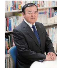
前新健センター長

本校は平成19年度に開校したKBC学園グループの学校です。歴史は浅いものの全国ファッション甲子園(3回)・全国まんが甲子園(2回)への出場、また県内最大の総合展「沖展」へは開校以来連続して入賞・入賞・奨励賞を輩出するなど少人数ながらも輝かしい実績をあげてまいりました。